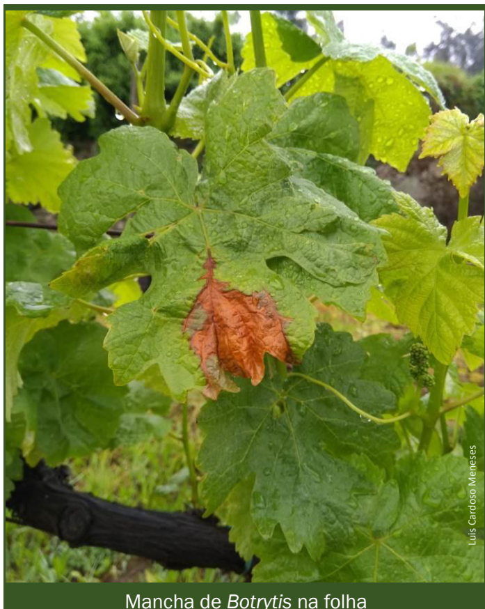
Mancha de Botrytis na folha

► Na plantação de vinhas novas, limitar o vigor da Vinha, escolhendo porta-enxertos, castas e até clones, que não confirmam excessivo vigor.