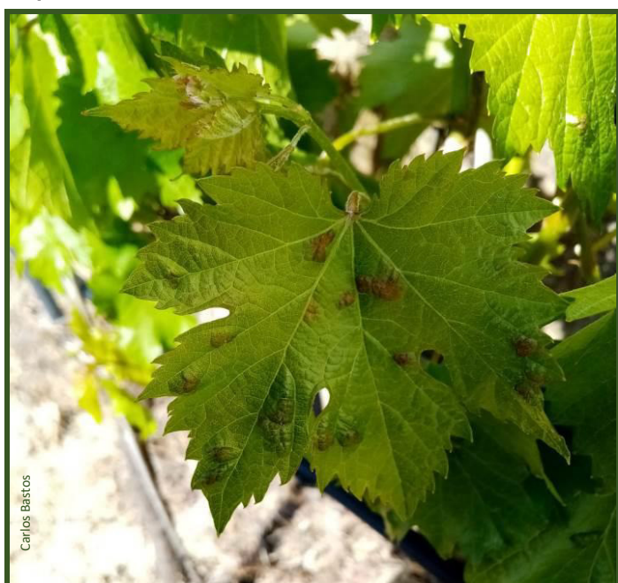
Sintomas precoces de erinose

Desaconselha-se a aplicação de acaricidas específicos.