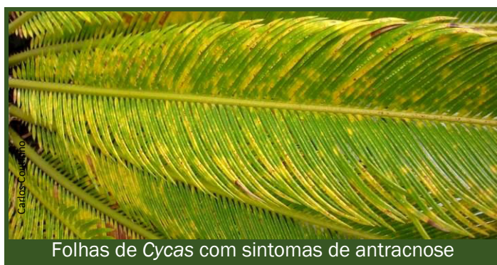
Folhas de Cycas com sintomas de antracnose

Não estão homologados fungicidas para o combate a esta doença. No entanto, os ensaios mostraram a eficácia da aplicação preventiva de fungicidas à base de cobre (hidróxido), procloraz , .